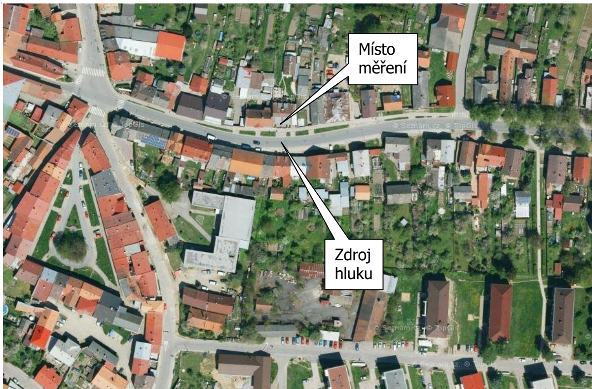
Obr.1: Situační fotografie zdroje hluku a měřícího místa- výstřižek z mapy: adrese Palackého 241, 588 13 Polná, okres Jihlava, Kraj Vysočina, Česko