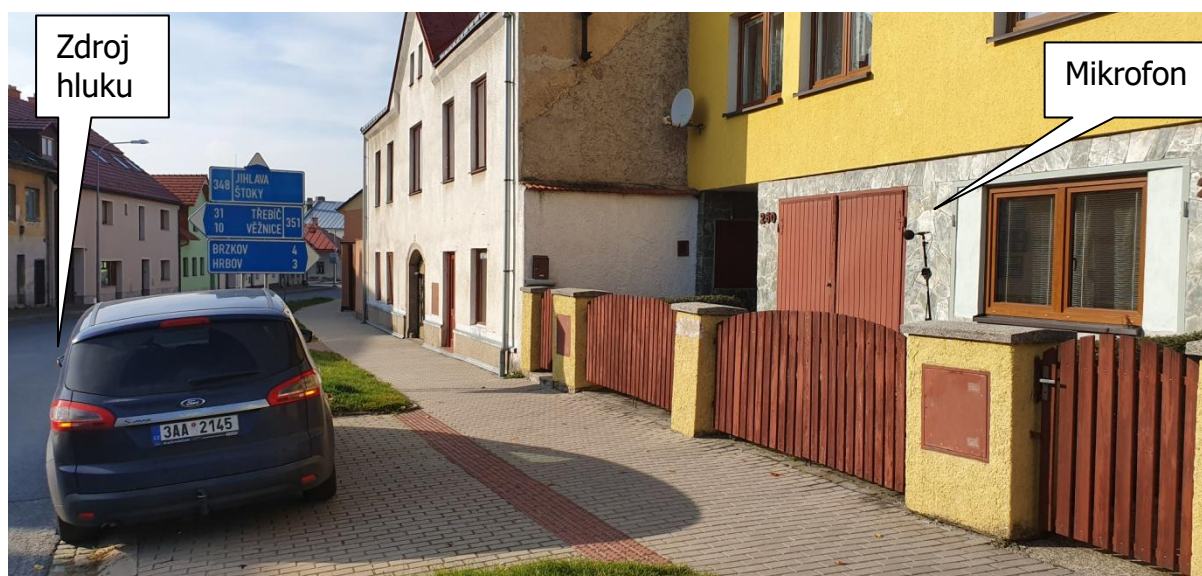
Obr.3: Fotografie měřicího místa, Palackého 241, 588 13 Polná, okres Jihlava, Kraj Vysočina, Česko