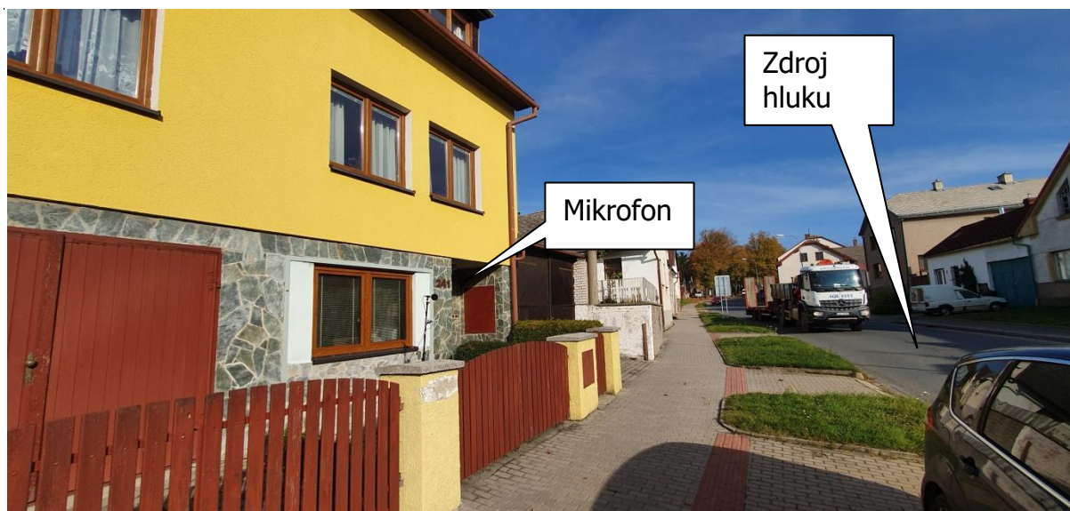
Obr.2: Fotografie měřicího místa, Palackého 241, 588 13 Polná, okres Jihlava, Kraj Vysočina, Česko